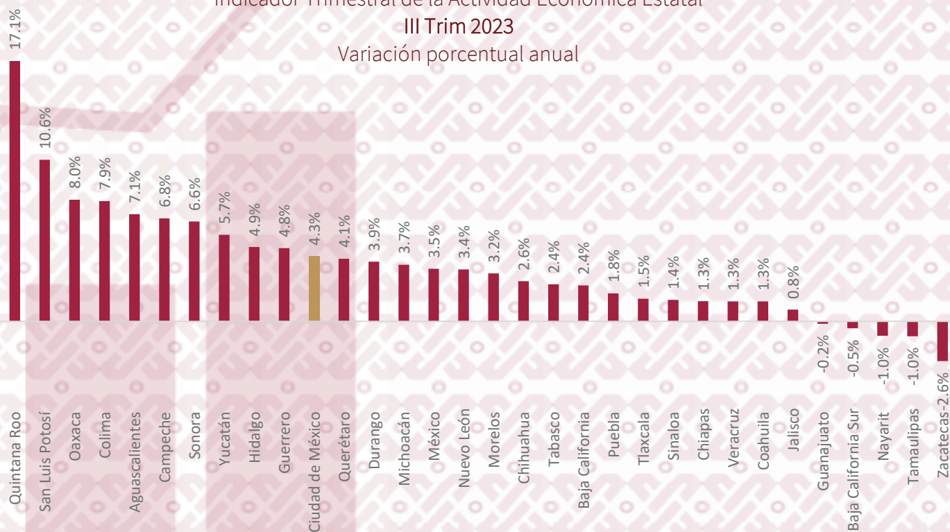
Indicador Trimestral de la Actividad Económica Estatal III Trim 2023 Variación porcentual anual

Los Estados que presentaron aumentos significativos fueron: Quintana Roo, San Luis Potosí, Oaxaca, Colima. La Ciudad de México, por su parte, presentó un aumento del 4.3% con respecto al Tercer trimestre de 2022.