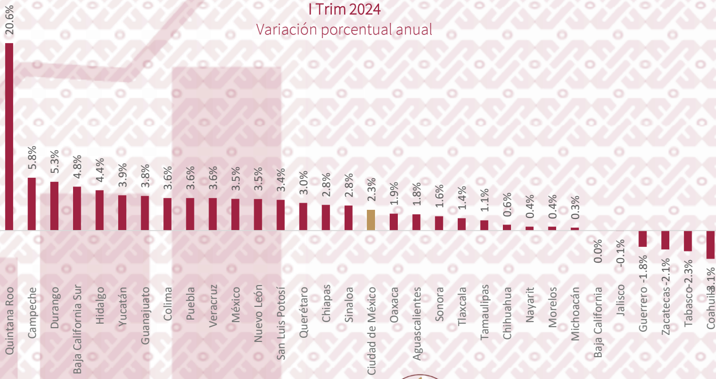
Indicador Trimestral de la Actividad Económica Estatal I Trim 2024 Variación porcentual anual

Los Estados que presentaron aumentos significativos fueron: Quintana Roo, Campeche, Durango, Baja California Sur. La Ciudad de México, por su parte, presentó un aumento del 2.3% con respecto al Primer trimestre de 2023.