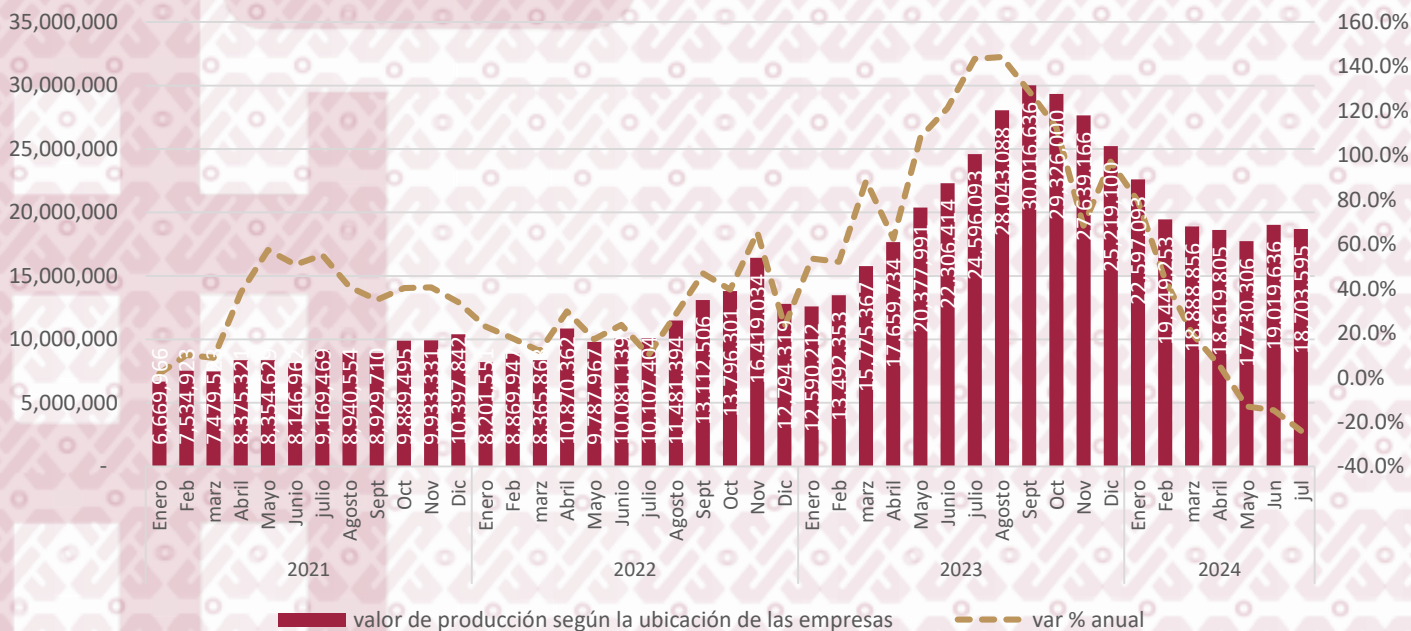
valor de la producción, según ubicación de las empresas en la Ciudad de México (millones de pesos corrientes)

Al séptimo mes de 2024 el valor de la producción acumulada ha sido de 135 mil 008 millones de pesos, lo que significa un aumento de 6.5% en comparación al mismo periodo de 2023.